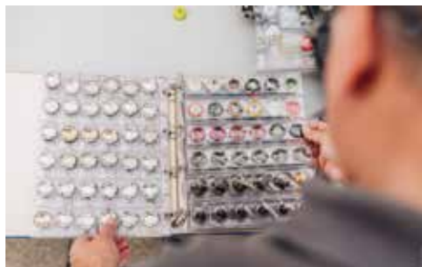
▲ Plaques de cava

Continuant la sèrie sobre els Capgrossos de Lleida, es podran adquirir les plaques dedicades als Capgrossos: el Gitano i la Senyora