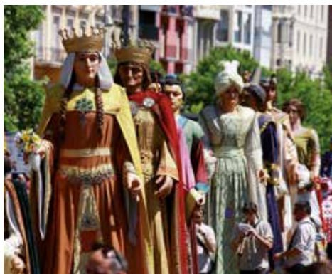
▲ Fotografia Xavier Pomés Lacalle

Des de la plaça Blas Infante i per la passarel·la cap a l'avinguda de Madrid, passant per davant del monument als Gegants, el carrer de Saracíbar, avinguda Blondel, carrer Vila de Foix, plaça de la Catedral, carrer Major, carrer Cavallers, avinguda de Blondel fins a la plaça Sant Joan.