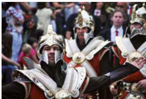
▲ Fotografia: Janet Esqué Sumalla