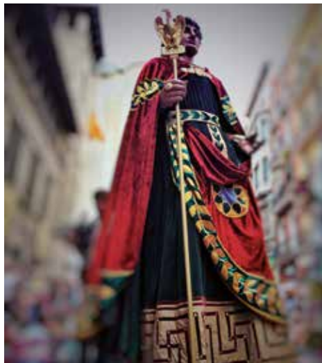
▲ Fotografia Anna Foix Gómez

S'habilitarà un espai per a persones amb cadira de rodes a la Batalla de flors, que se celebra l'11 de maig a les 18 h a la rambla de Ferran (al costat de la Tribuna d'Autoritats).