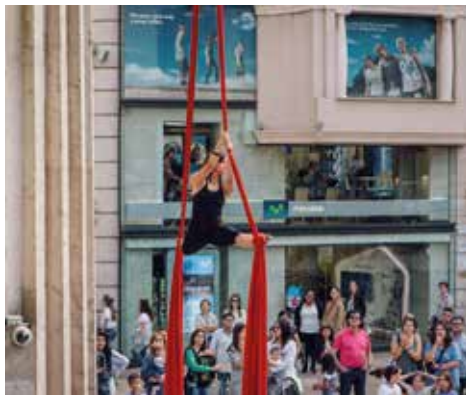
▲ Acrobacies INEF

Hi col·labora: C.F. Pardinyes, Ajuntament de Lleida, ORVEPARD, Consell Esportiu del Segrià i Plusfresc