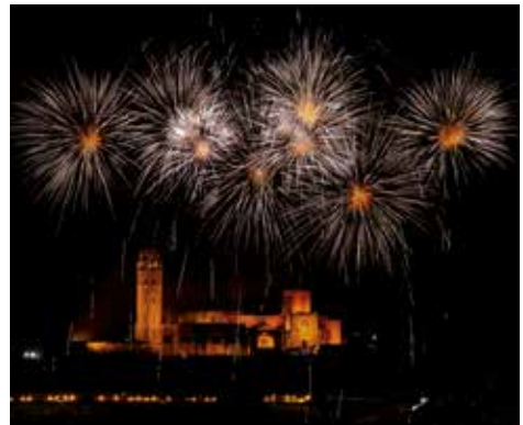
▲ Fotografia: Joan Marín AVECILLA

Acabem la Festa Major, gaudint dels sons i les formes de llum i colors que omplen el cel de la ciutat.