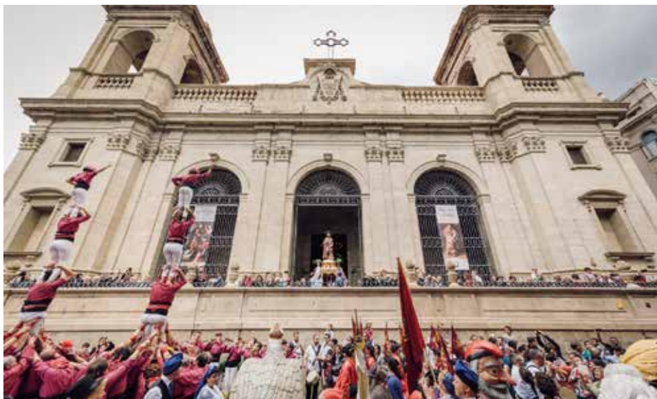
▲ Fotografia: Jordi Rulló