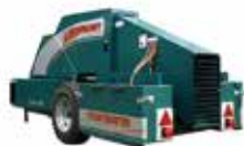
Frostbuster Protección máxima 8 hectáreas