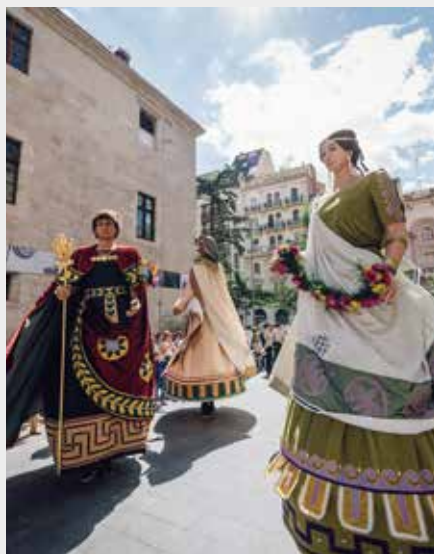
▲ Fotografia (fragment) Jordi Rulló