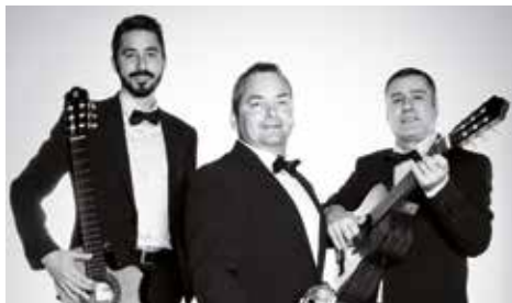
▲ Arrels de Menorca

Arrels de Menorca, Arrels de la Terraferma i Boira