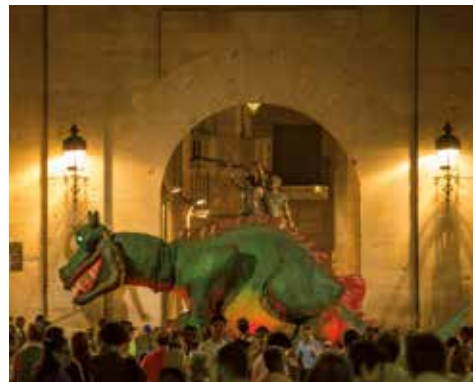
▲ Fotografia: Jordi Rulló

Fi de la Festa Major amb les darreres ballades dels Gegants de Lleida i salutació del Marraco ●●●