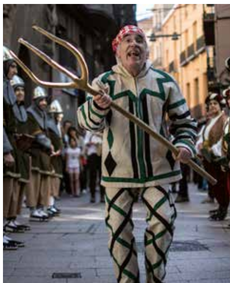
▲ Fotografia (fragment): Ivan Cornella Casado

Conferència musicada a càrrec de Ramon Fontova i amb la col·laboració de l'Aula de Sons de Lleida. Conferència sobre aquest Ball parlat lleidatà del que en trobem notícies ja des del s. XVIII i que es torna a balla a la Festa Major de Lleida des de l'any 2010.