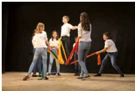
▲ Esbarts Arrels

Ho organitza: Arxiu Arqueològic. Secció d'Arqueologia de l'Ajuntament de Lleida Gratuït