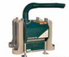
FrostGuard Protección máxima 1 hectárea