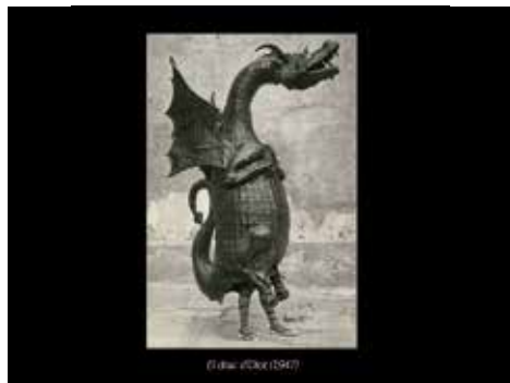
▲ Expo Pirotècnia de Festa

Ho organitza: la Casa dels Gegants i l'Associació de Cultura Popular i Tradicional Aurembiaix de Lleida, el Museu Etnològic i les Cases de la Festa de Barcelona i l'Ajuntament de Reus