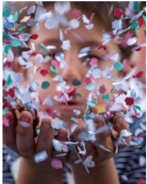
▲ Fotografia: Eloy Serrat Grasal

Comptarem amb l'animació: El Gran Magi i els Saragatus, Brass The Gitano Band i La Banda Retocada . El Marraco participa a la Batalla de Flors durant la primera volta de les carrosses →