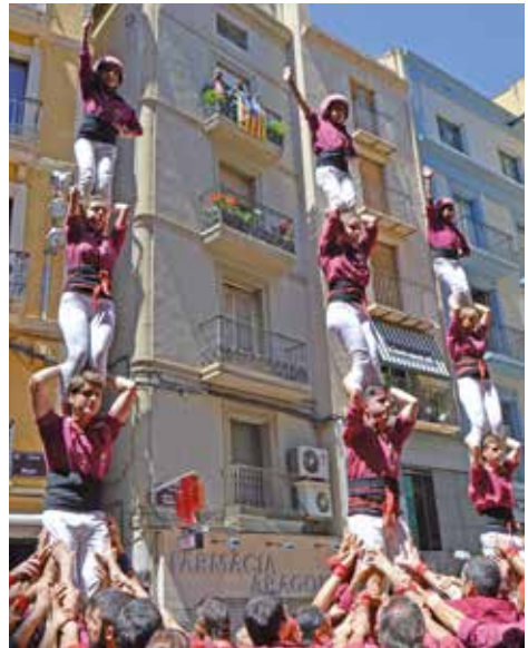
▲ Fotografia: M a Tresa Oliva Viladegut

12 h. Castell dels Templers de Gardeny/Turó de Gardeny