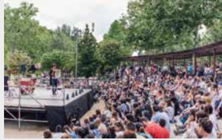
▲ Parc de Somriures