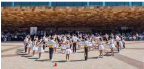
▲ Fotografia: Jordi Rulló

Ho organitza: Grup Sardanista Montserrat