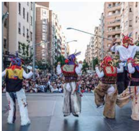
▲ Fotografia: Jordi Rulló

Ho organitza: Fòrum ciutadà per la cohesió social FOCCS, regidoria de participació ciutadana, drets civils i cooperació de l'Ajuntament de Lleida