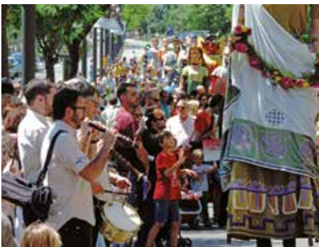
▲ Fotografia Gerard Castells Alcubierre

Ho organitza: Aula de Sons de Lleida, Colla Gegantera dels Gegants de la Paeria.