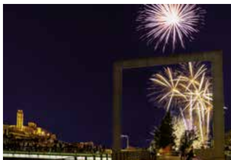
▲ Castell de focs

Més informació: www.castellersdelleida.cat Ho organitza: Castellers de Lleida Gratuït