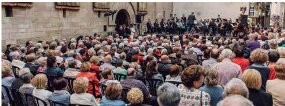
▲ Fotografia: José M a Baró Vidal

Feu d'artifice tiré par la pyrotechnie TOMÁS →