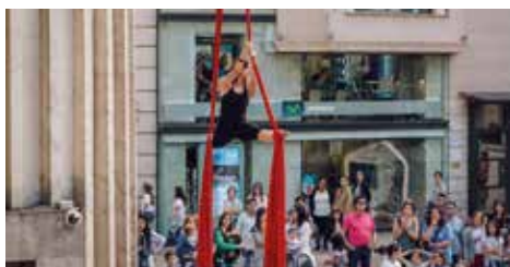
▲ Acrobacies INEF

Soirée de danses et acrobaties avec le Club INEF