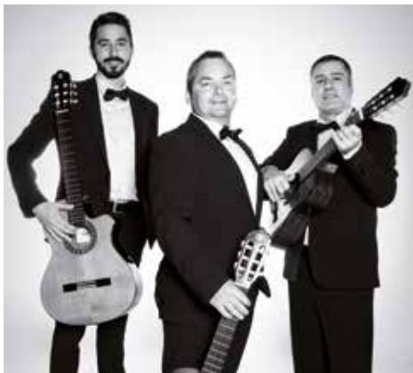
▲ Arrels de Menorca

Chant «d'Havaneres»: BOIRA, ARRELS DE LA TERRAFERMA ET ARRELS DE MENORCA