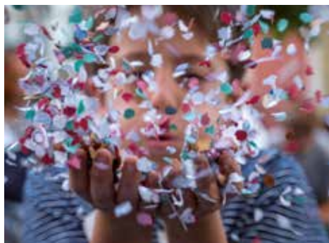
▲ Fotografia: Eloy Sarrat Grasal

18 h. Rambla de Ferran Bataille de Fleurs