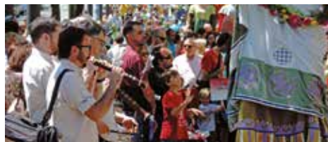
▲ Fotografia Gerard Castells Alcobierre

11 h 30. Pati de les Comèdies Bals des Géants de Lleida!