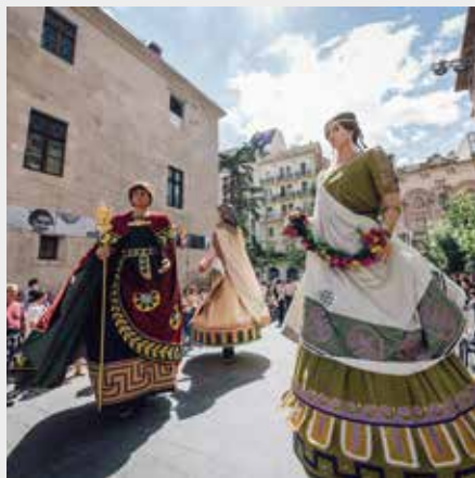
▲ Fotografia Jordi Rulló

11 h 30. c. Vila de Foix - Bals de Géants