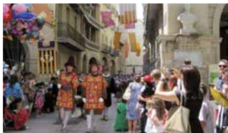
▲ Fotografia: Ester Bonell Rubió

12 h 15. Nouvelle Cathédrale Départ de Sant Anastasi et Procession