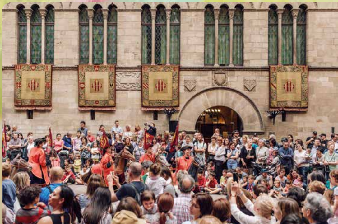
▲ Fotografia: Jordi Rulló