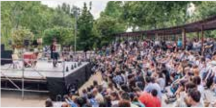
▲ Parc de Somriures (à Jordi Rulló)

ZONE PETIT TRAIN D'11 à 14 h et de 17 à 20 h. Festa i fusta [jeux]