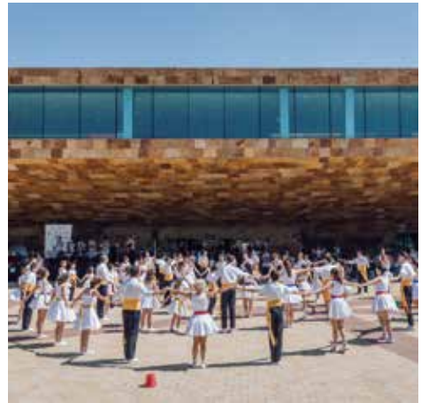
▲ Fotografia: Jordi Rulló

11 h30. Place de la Llotja 70e Concours de Lleida. Championnat de Catalogne de «Sardanes» et Championnat de la Terra Ferma avec la «Cobla» Contemporània