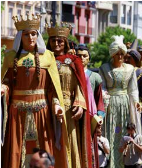
▲ Fotografia Xavier Pomés Lacalle

11 h. Place Blas Infante XXXV Rencontre de Géants / Regroupement des Géants