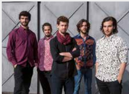
▲ Aurora2_©Clara Cardona