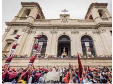
▲ Fotografia: Jordi Rulló

11 h et 12 h. Campi qui Pugui “Manneken's Piss” (installation humeur gestuelle)