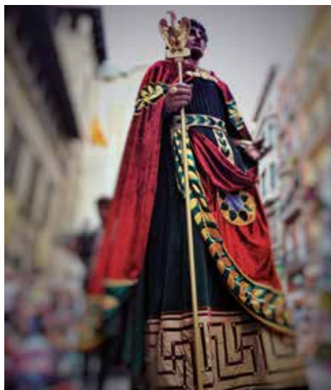
▲ Fotografia Anna Foix Gómez

La Festa Major est ouverte à tout le monde. Ce sont des jours où la participation des citoyens est la clef pour pouvoir se régaler de la ville. Les espaces fériés sont accessibles aux personnes handicapées. Il y aura un espace pour les fauteuils roulants à la Bataille de fleurs, que se célèbre le 11 mai à 18 h à la rambla de Ferran (à côté de la Tribune des Autorités). Les actes suivants de la Festa Major