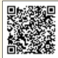
App Cultura Lleida

Les fotografies: part de les fotografies que il·lustren aquest programa pertanyen als participants de Fotomaig 2016