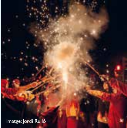
imatge: Jordi Rulló

Recorregut: c. de les Monges, c. la Palma, c. Caldereries, av. Blondel i final del trajecte davant de la pl. Sant Francesc