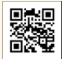
Web de Festes