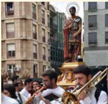
autor: Josep Maria Currià Curcó

Ball de Moros i Cristians, Bastoners del Pla de l'Aigua, el Ball de Cavallets, els Capgrossos, els Gegants, els Heralds i els Signífers amb el Penó i les Trampes, les Pubilles, els Ministrers de Lleida, la imatge de Sant Anastasi, les autoritats eclesiaístiques, els Macers, la bandera de la ciutat, la Corporació Municipal i la resta d'autoritats i representacions, la Banda Municipal, l'Àliga, els Castellars de Lleida, els càrrecs de la Festa de Moros i Cristians de Lleida, els infants amb el vestit típic de català en representació de les associacions cíviues i veïnals, les entitats de cultura popular i tradicional i les cases regionals